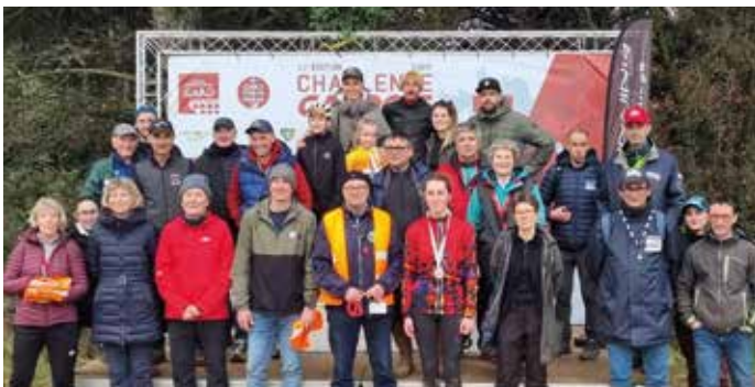
challenge gardois de VTT organisé par le Vélo tonic vauverdois au bassin des Plaines, le 23 février sur un terrain qui avait bien absorbé la pluie... Une partie des membres et bénévoles qui concourent à la réussite de l'évènement