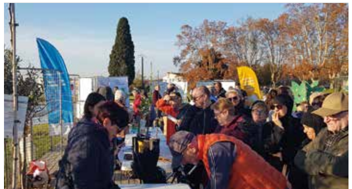
joli succès de l'opération J'adopte un arbre en novembre au parc de l'Espéron avec un arbre à emporter ou à planter dans le parc.