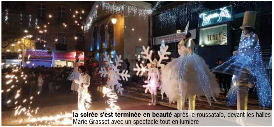
la soirée s'est terminée en beauté après le roussataïo, devant les halles Marie Grasset avec un spectacle tout en lumière