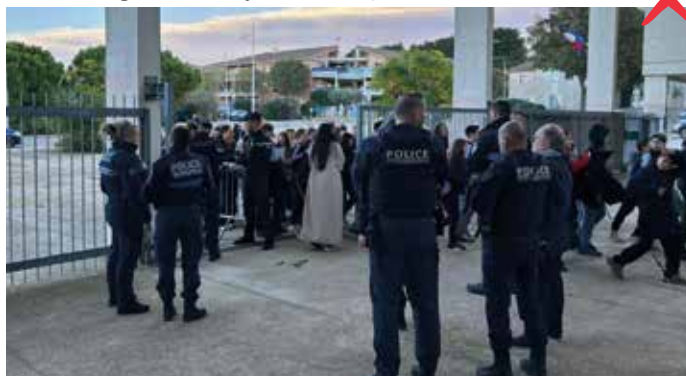
une bonne entente entre la ville, la gendarmerie et le collège La Vallée verte pour mener des actions de protection de la population

L'action partenariale sera poursuivie par l'établissement avec une sensibilisation auprès des parents, afin de rappeler à tous les règles du bon usage de ce moyen de transport.