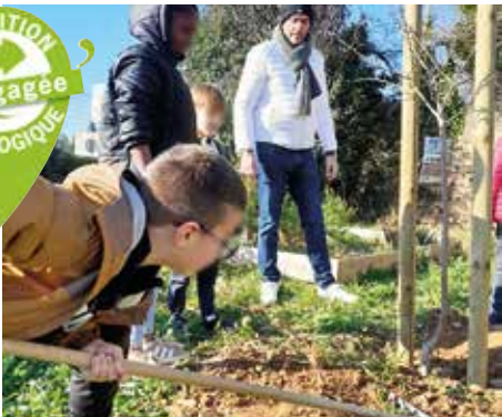
plantation de 4 arbres feuillus à l'école Libération, le 16 janvier pour enrichir l'espace végétalisé