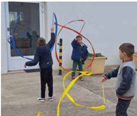
une belle énergie est nécessaire pour faire virevolter les rubans au centre de loisirs

https://petite camargue.portail- famille.app/home