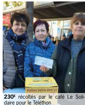
230€ récoltés par le café Le Solidaire pour le Téléthon