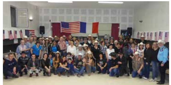
joli succès du bal country du 22 février, proposé par Friend's country au foyer communal de Gallician, prochain rdv le 10 mai à la salle Bizet !