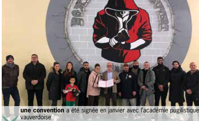
une convention a été signée en janvier avec l'académie pugilistique vauverdoise