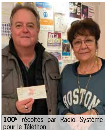
100€ récoltés par Radio Système pour le Téléthon