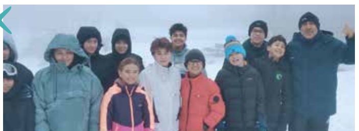
week-end neige organisé par le service municipal de la jeunesse au Mont Aigoual du 24 au 26 janvier pour prendre un peu d'altitude sur les cimes du département

violiniste et de découvrir cet instrument. Un temps de partage proposé par un parent au cours duquel les élèves ont chanté des chants préparés pour l'occasion.