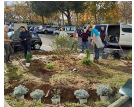
végétalisation de l'espace vert à la résidence du Daudet par les habitants en novembre