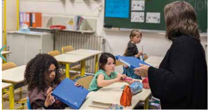
pour bien s'organiser , chaque élève concerné par le dispositif du CLAS a reçu sa pochette comprenant un stylo, une règle et un cahier.