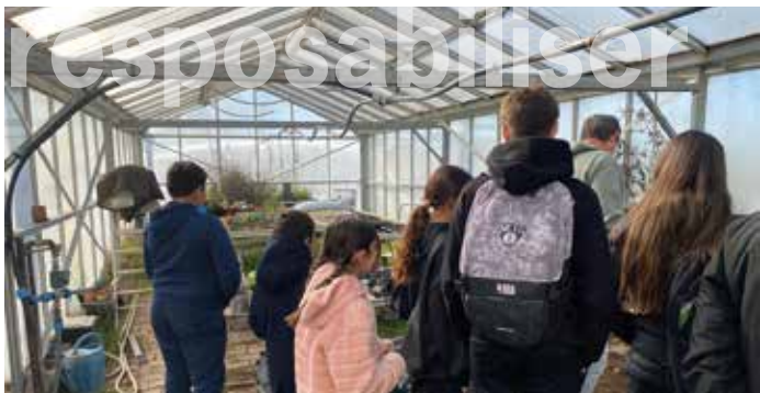
les éco-délégués de l'école Libération ont rencontré ceux du collège La Vallée verte pour connaître leurs projets sur le tri des déchets, un partage d'informations pour faire naître des idées d'actions