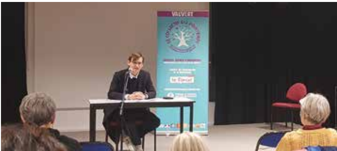
la laïcité pour mieux vivre ensemble et garantir les liberté de convictions de chacun avec la conférence sur le Vauverdois Raoul Allier qui a participé à l'élaboration de la loi du 9 décembre 1905 sur la séparation de l'église et de l'Etat par Nicolas Cadène, ancien rapporteur de l'Observatoire national de la laïcité. Action proposée par le collectif du printemps de l'éducation le 10 décembre.