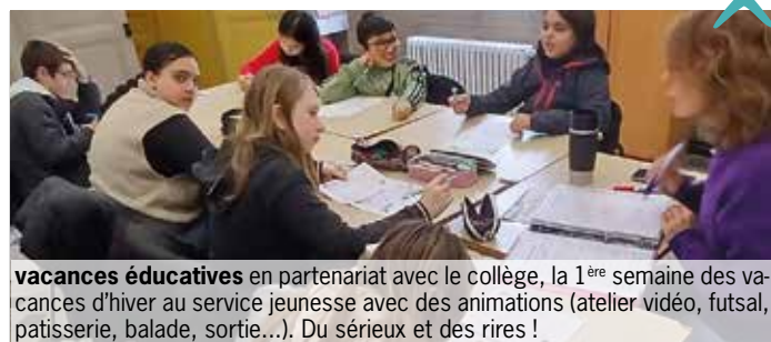
vacances éducatives en partenariat avec le collège, la 1 ère semaine des vacances d'hiver au service jeunesse avec des animations (atelier vidéo, futsal, pâtisserie, balade, sortie...). Du sérieux et des rires !