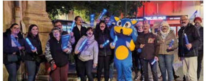
dans le cadre de Movember : concert Dead After Dinner à la salle Bizet précédé de la marche bleue organisés le 15 novembre par les Démoniaks , Les Roses du Gard et le CCAS