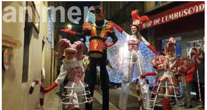
parade de Noël illuminée avec cavaliers, échassiers, danseurs, acrobates, feux froids et bien sûr le père Noël sur son char le 14 décembre