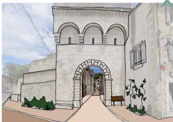
simulation des travaux prévus dans la rue Posquière et la ruelle du Four, par le CAUE du Gard

La ville réhabilite cette rue avec la rénovation des réseaux humides par la Saur, l'enfouissement des réseaux secs par le Smeg, la réfection de la voirie et le réaménagement de la rue en lien avec le CAUE du Gard. Il est prévu de supprimer les branchements en plomb, de faciliter la marche à pied en centre-ville, de mettre en valeur le patrimoine et d'améliorer le cadre de vie avec une végétalisation. Ces travaux sont conçus avec la rénovation de la place Gambetta prévue dans le programme Petites villes de demain . Les travaux rue Posquière sont prévus jusqu'au 31 mars pour un coût de renouvellement des réseaux humides de 190 070€ TTC, l'enfouissement des réseaux secs pour 22 250€ dont 14 000€ de subventions.