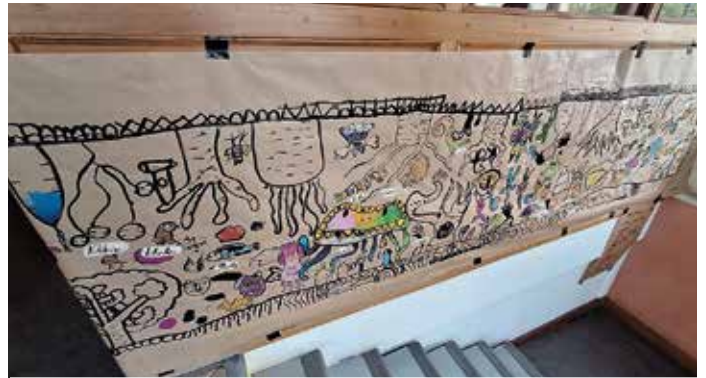
... et voici le résultat ! une jolie réalisation qui a du caractère, à admirer à la médiathèque