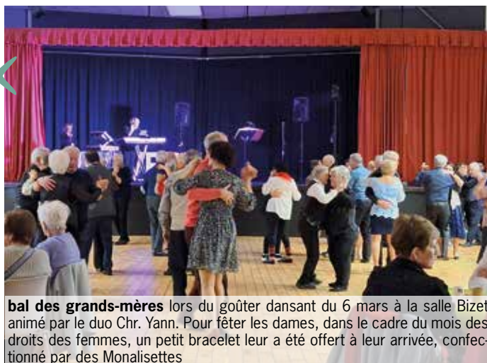
bal des grands-mères lors du goûter dansant du 6 mars à la salle Bizet animé par le duo Chr. Yann. Pour fêter les dames, dans le cadre du mois des droits des femmes, un petit bracelet leur a été offert à leur arrivée, confectionné par des Monalisettes