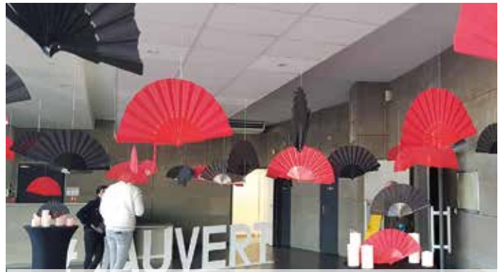
olé ! décoration du hall d'accueil de la salle Bizet pour le spectacle Carmen : le service de la culture mise aussi sur un accueil soigné du public