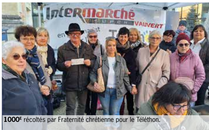
1000€ récoltés par Fraternité chrétienne pour le Téléthon.