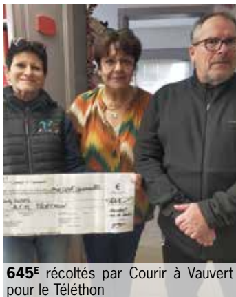
645€ récoltés par Courir à Vauvert pour le Téléthon