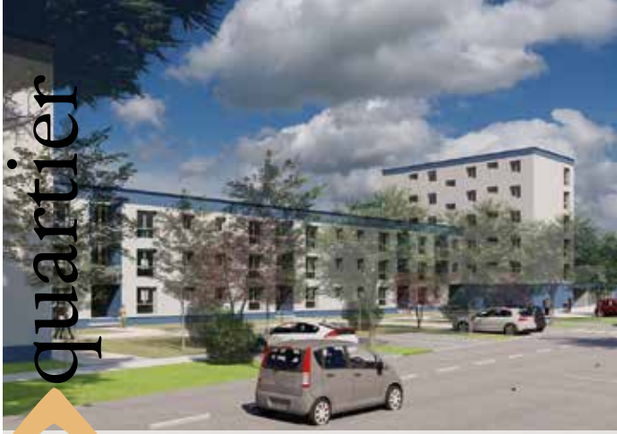
projection de la résidence Le Montcalm par Sarl ARC&types Brugvin Gilly Bonnefoy architectes DPLG associés