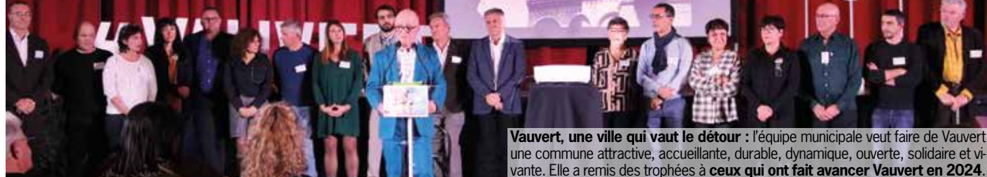
Vauvert, une ville qui vaut le détour : l'équipe municipale veut faire de Vauvert une commune attractive, accueillante, durable, dynamique, ouverte, solidaire et vivante. Elle a remis des trophées à ceux qui ont fait avancer Vauvert en 2024.