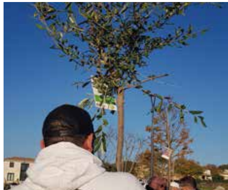
au choix parmi diverses essences , les familles ont pu repartir avec un arbre ou le planter sur place