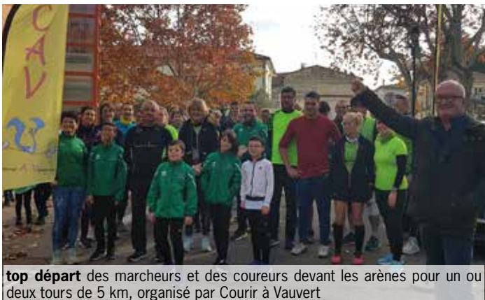
top départ des marcheurs et des coureurs devant les arènes pour un ou deux tours de 5 km, organisé par Courir à Vauvert