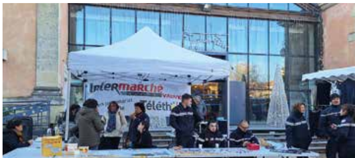
8290,36€ ont pu être récoltés au profit de l' AFM Téléthon 2024 qui est organisé tout au long de l'année par le CCAS avec la Maison pour tous R. Gourdon et les associations et un temps fort ici avec les sapeurs pompiers le 30 novembre qui ont récolté 302€ . Dans cette somme on compte 300€ de l'association vauverdoise de culturisme, 400€ du centre chorégraphique de Petite Camargue