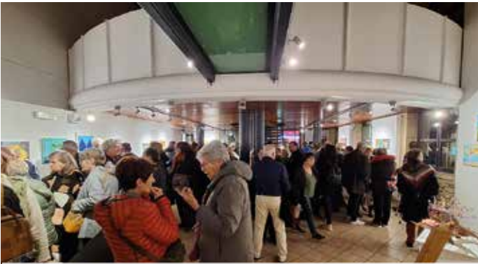
8 e salon des artistes amateurs en janvier à l'espace culture, où les participants locaux ont présenté des œuvres sur le thème Couleurs du sud