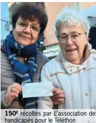
150€ récoltés par L'association des handicapés pour le Téléthon