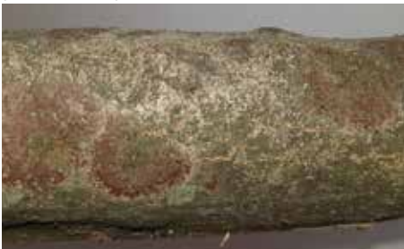
les oliviers atteints de la maladie de l'œil de paon présentent des taches rougeâtres sur les branches

Les oliviers de ce jardin étant atteints de la maladie de l'œil de paon, (voir photo ci-contre), les services techniques ont dû réaliser une taille rigoureuse. En effet, la ville étant labellisée Terre saine, seule cette taille est le traitement autorisée pour enrayer cette maladie et permettre aux oliviers de repartir de plus belle.