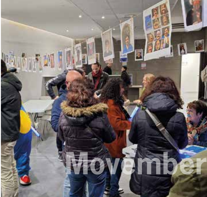
la plus belle moustache ! exposition et concours dans le hall d'accueil de la salle Bizet pour la soirée Movember le 15 novembre