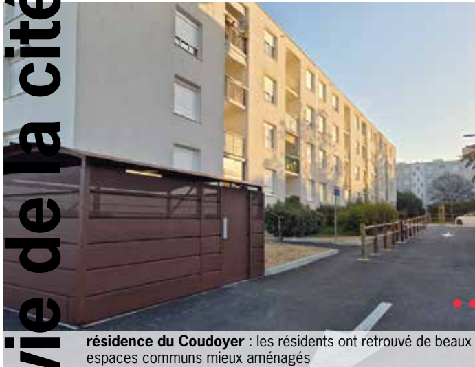
résidence du Coudoyer : les résidents ont retrouvé de beaux espaces communs mieux aménagés