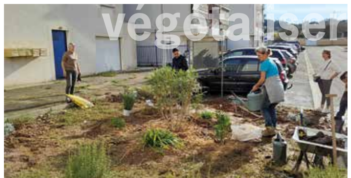
les habitants jardinent ensemble sur l'espace vert en pied d'immeuble du Daudet et dans 4 jardinières, un travail réalisé en accord commun