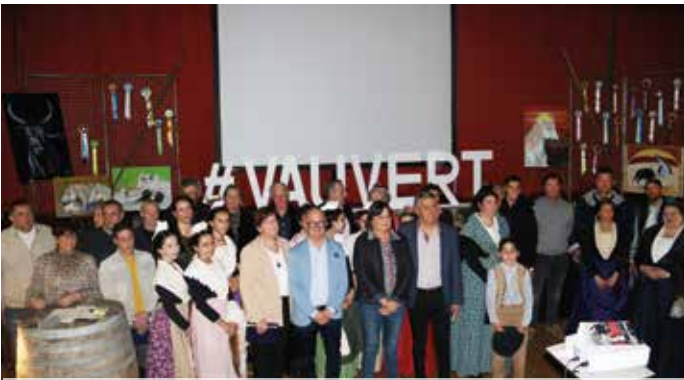
photo finale avec ceux qui ont œuvré à la réussite de la saison taurine 2024 dans nos arènes Jean Brunel