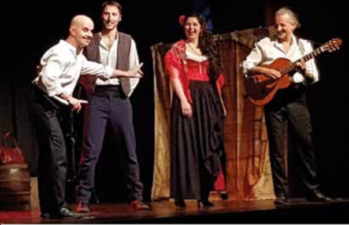
Carmen , un spectacle de la Cie Pa prod production, à l'humour bon enfant pour un public venu en nombre y assister à la salle Bizet le 19 janvier