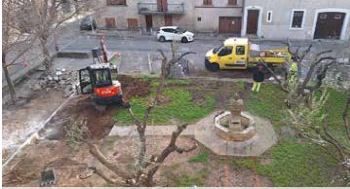
jardin de la mairie, futur jardin Missak et Mélinée Manouchian