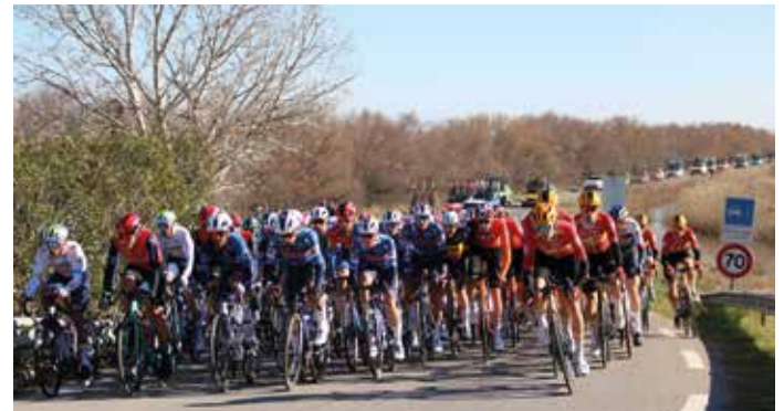
Etoile de Bessèges : les coureurs sont aussi passés le 5 février par le hameau de Gallician