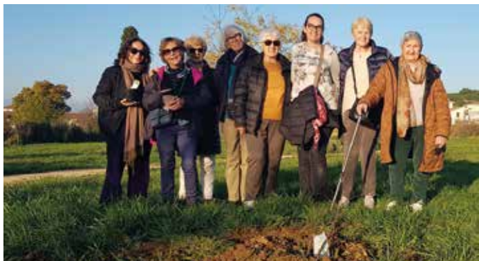
le voir grandir : c'est ce qu'espère l'équipe de Monalisa qui a adopté un petit arbre. Ces dames ont bien ri en le plantant et lui rendent visite au parc.