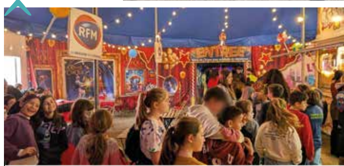
plein des yeux ! lors des vacances d'hiver plus de 100 enfants du centre de loisirs sont allés au cirque à Montpellier. Les grands ont ensuite organisé une kermesse sur le thème du cirque pour tous avec jeux d'adresses, parcours de motricité, atelier maquillage, pop-corn...