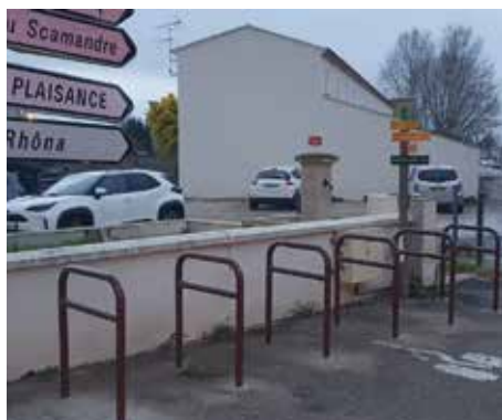
49 arceaux à vélos ont été installés à Gallician et dans Vauvert le 3 mars sur un total de 100 quand l'action sera terminée

La seconde phase est ouverte à la consultation, les propositions peuvent être adressées à duate@vauvert.com