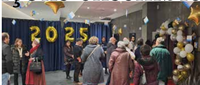
avançons ensemble en 2025 , la municipalité se présente chaque année lors de la cérémonie des vœux aux habitants, à la salle Bizet le 24 janvier

La ville poursuivra l'amélioration de la voirie initiée en 2024 (5km de rues refaites). Des aménagements continueront d'être proposés pour abaisser la vitesse, sécuriser la circulation des piétons et des vélos, tout en améliorant les possibilités de stationnement. Une équation difficile à mener mais qui a porté ses fruits en 2024 avec la mise en sens unique de certaines rues. L'amélioration du stationnement des véhicules sera menée. Transports et mobilités Les travaux de réalisation du PEM (pôle d'échange multimodal) démarreront enfin, après des retards dus pour l'essentiel au désengagement de l'Etat en matière ferroviaire et à la nécessité pour la Région d'étaler ses investissements. Ces travaux transformeront complètement le quartier de la gare et offriront aux Vauverdois de nouvelles possibilités de mobilités vers Nîmes. Un aller-retour supplémentaire en train vers Nîmes est effectif depuis l'automne 2024 et deux nouveaux allers-retours devraient être déployés par la Région