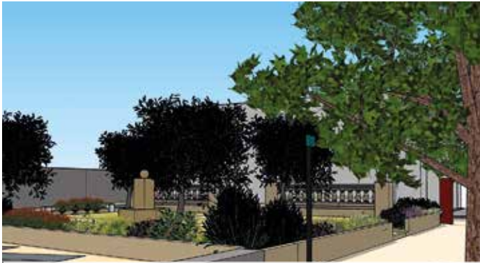
simulations du projet par le service aménagement de la direction de l'urbanisme de l'aménagement et de la transition écologique

Plusieurs actions importantes pour la commune vont concourir à soutenir la mémoire collective sur notre histoire.