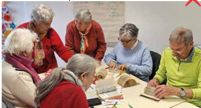
tout au long de l'année des ateliers permettent de se retrouver pour partager un bon moment autour d'activités partagées et variées à la salle des Saladelles

contact : CCAS Françoise Guillaumet 04 66 73 17 80